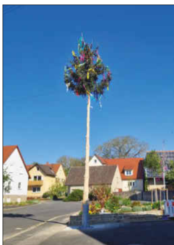
gez. Roman Menth Erster Bürgermeister

Der Elternbeirat des Städtischen Kindergartens Aub hat in einigen Arbeitseinsätzen die Spielgeräte geschliffen und neu gestrichen sowie die Pflanzbeete neu gestaltet. Der Außenbereich des Kindergartens erstrahlt nun in neuem Glanz und die Kinder dürfen schon gespannt auf die erste Ernte der neu gepflanzten Früchte sein. Dem Elternbeirat sowie allen Helferinnen und Helfern sei an dieser Stelle herzlich gedankt.